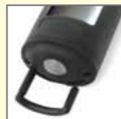
Auszieh- und drehbarer Befestigungshacken