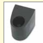
Ladestation mit kontaktem Ladeschacht