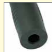
Eintauchöffnung für Ladespule